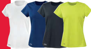
WHITE (WHT) NAVY (339S) BLACK (BLK) LIME GREEN (382)