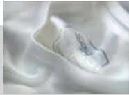
Printed inner neck label

Decorators access: Open Decoration process: Transfer print, embroidery