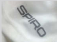
Reflective SPIRO print logo