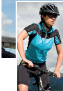
Womens sizes (Page 36)