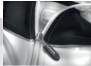
Full front zip opening

Decorators access: Open Decoration process: Transfer print, embroidery