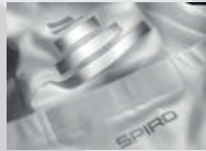
Reflective print design central back position for enhanced visibility