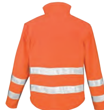
Fashionable shaped longer back panel